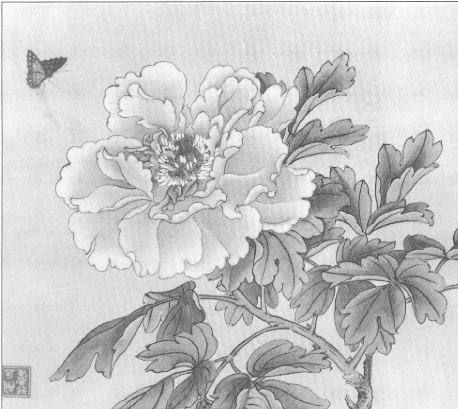
Yu Fei'an, 1946. Met inkt geschilderde pioenroos met blad

bedoeld werd met jiao , nong , zhong , dan en qing .