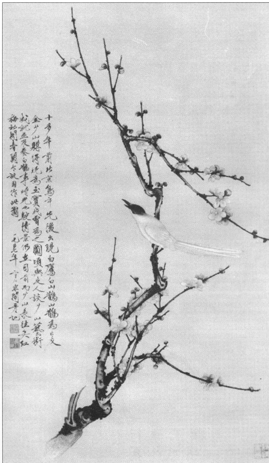
Yu Fei'an, 1957. Rode pruimen en witte ekster

Ik las geboeid over de bereiding en verwerking van mineralen als malachiet, azuriet, vermiljoen en orpiment, tot ik bij het hoofdstuk over inkt en andere zwarte kleurstoffen kwam. Daar ontdekte ik dat de Chinezen zwart als een echte kleur beschouwen. Dat is in tegenpraak met alles wat ik over de westerse kleurtheorieën geleerd heb. In de westerse schilderkunst geldt zwart juist als de ontkenning van kleur, eigenlijk als 'niet-kleur'. Het westerse kleurschema is gebaseerd op de breking van licht door een prisma, waarbij alle kleuren van de regenboog tevoorschijn komen, en daar hoort zwart niet bij. In China heeft men dus een ander kleurbegrip, rood en geel vormen een glijdende schaal waar ook bruin en oranje onder kunnen vallen. Blauw en groen zijn niet